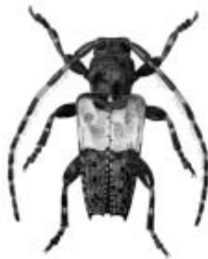
Hvidbåndet gråbuk - Pogonocherus hispidulus

hvidbåndet gråbuk • — Pogonocherus hispidulus hvidbåndet pragtbille • — Trachys minutus hvidbåndet vædderbuk se hvidtjørnshvepsebuk hvidhovedet bredsnudebille • — Platystomos albinus