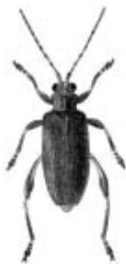
Åkandesivbuk - Donacia crassipes

ægstumpbiller — Acritus ægte klobiller se klobiller ægte rovbiller se rovbiller ægte værftbille se egeværftbille ødebiller — Byrrhidae øjenløbere — Elaphrus øjenrovbiller • — Stenus øjepletet mariehøne — Anatis ocellata ørekløbiller — slægten Dryops og familien Dryopidae •. øresnudebiller — Otiorhynchus ørkenløber se tofarvet hedeløber ørkenløbere se hedeløbere ådselbiller 1 — Silphidae ådselgraver se krumbenet ådselgraver og sandådselgraver. ådselgravere — Nicrophorus ådselstumpbille — Margarinotus brunneus åkandebille — Galerucella nymphaeae åkandebille se åkandebille åkandesivbuk • — Donacia crassipes