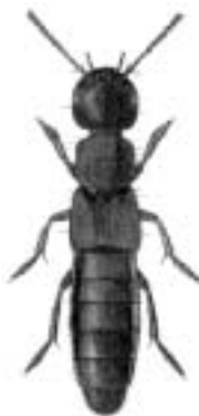
Stor rovbille - Ocypus olens

olens, Ocypus — stor rovbille oleracea, Altica — stor blå jordloppe Olisthopus — planløbere Omosita — bengnavere Ontholestes — jagtrovbiller Onthophagus — møggravere Onthophilus — ribbestumpbiller Oodes — vandløbere opaca, Aclypea — matsort ådselbille opacus, Tenebrio — egeskrubbe Ophonus — kalkløbere