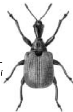
Hasselbladruller - Apoderus coryli

coryli, Apoderus — hasselbladruller coryli, Cryptocephalus — hasselfaldbille