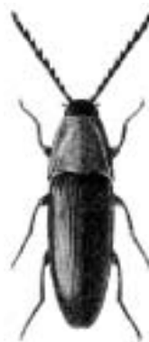
Pragtsmælder - Ischnodes sanguinicollis

planløber • — Olisthopus rotundatus planløbere — Olisthopus plasterbiller — Meloidae plasterbiller og oliebiller se plasterbiller plebejisk metalløber se plebejisk ovalløber plebejisk ovalløber • — Amara plebeja pletbukke se gråbukke plethornet løvsnudebille 1 plettet askebarkbille — Hylesinus fraxini plettet barkbuk se mørkbåndet gråbuk plettet blomsterbuk se sydlig blomsterbuk plettet dværgsmælder — Oedostethus quadripustulatus plettet skjoldbille — Cassida nebulosa plettet smalbuk se sydlig blomsterbuk og blodrød blomsterbuk. plettet smalløber se klitsmalløber plettet springvandkalv • — Laccophilus hyalinus plettet sumpvandkalv se plettet springvandkalv plettet tømmerbuk 2 plettet vandtræder — Peltodytes caesus plettet vædderbuk se sortgrå hvepsebuk plump metalløber se plump ovalløber plump ovalløber • — Amara ingenua polarløber • — Miscodera arctica polarløbere — Miscodera poppelbladbiller — Chrysomela populi poppelbuk — Saperda carcharias poppelbukke se kravebukke poppelens bladbiller se poppelbladbiller poppelglansbille se poppelbladbiller poppelguldbille se rækkepunkteret guldbille poppelloppe 3 pragtbilleagtig skovbuk se valsebuk pragtbiller — Buprestidae pragtløbere — Carabus pragtsmælder • — Ischnodes sanguinicollis pragtsumpløber — Badister unipustulatus