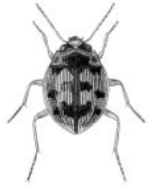
Kugleløber - Omophron limbatum

kugleløber — Omophron limbatum kuglestrømvandkalv • — Oreodytes sanmarkii kuglestumpbiller — Abraeus kugletyv • — Sphaericus gibboides kuglevandkærer • — Anacaena kulsort jordløber — Pterostichus anthracinus kulsort markløber se kæmpesandløber kulsort muldløber se kulsort jordløber kvalkvedbladbiller — Pyrrhalta viburni kvikløbere — slægterne Agonum 1 , Anchomenus •, Platynus • og Sericoda •. kystglansløber • — Bembidion normannum