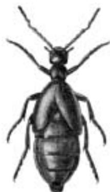
blå oliebil - Meloe violaceus