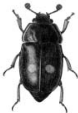
Toplettet bengnaver - Nitidula bipunctata

bipunctata, Nitidula — toplettet bengnaver