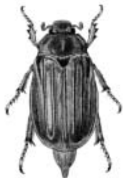
Almindelig oldenborre - Melolontha melolontha

maderae, Calosoma — strandpupperøver mali, Scolytus — stor æblebarkbille Malthinus — dværgblødvinger Malthodes — dværgblødvinger mandibularis, Prostomis — talgvedbille mannerheimii, Bembidion — Mannerheims glansløber marginalis, Dytiscus — stor vandkalv marginata, Amphotis — myrekøllebille marginatum, Agonum — gulrandet kvikløber marginatus, Dalopius — smal kornsmælder marginatus, Margarinotus — træsaftstumpbille marginellus , Dromius se schneideri , D. maritima, Cicindela — klitsandspringer maritimum, Bembidion — vade-glansløber marmorata, Liocola — stor guldbasse Masoreus — steppeløbere mauritanicus, Tenebroides — kornnaver maurus, Microlestes — dværgstumpløber maxillosus, Creophilus — skrækrovbille maxillosus, Oxyporus — jysk ildrovbille Megalopodidae — bladbiller melanarius, Pterostichus — markjordløber melancholicus, Harpalus — klitsandløber Melandrya — ribbevinger Melandryidae — svampespringere melanocephalus, Calathus — rødbrystet torpedoløber melanocephalus, Cercyon — sortrød landkær melanocephalus, Dromius — bleggul sivløber melanogrammum, Strophosoma — stribet gråsnude melanopus, Oulema — kornbladbiller Melanotus — sortsmældere melanura, Leptura — sortsømmet blomsterbuk melanura, Nacerdes — bolværksbille melanura, Odacantha — rødløber Meligethes — glimmerbøsser melletii, Ophonus — kort kalkløber Meloe — oliebiller