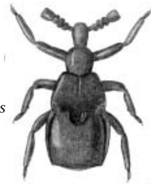
Gul kølledrager - Claviger testaceus