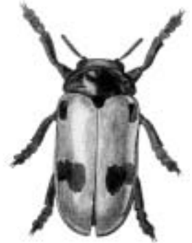
Myrebladbill - Clytra quadripunctata

quadripunctata, Clytra — myrebladbill quadripunctata , Dendroxena se quadrimaculata , D. quadripunctata, Sericoda — brandkvikløber quadripunctatus, Harpalus — firepunktet markløber quadripustulatus, Exochomus — fireplettet mariehøne quadripustulatus, Mycetophagus — stor svampebill quadripustulatus, Oedostethus — plettet dværgsmælder quadrisignatus, Dromius — risgærdebarkløber quadristriatus, Trechus — markgrotteløber quadrisulcatus, Chlaenius — sribet fløjlsløber quatuordecimguttata, Calvia — fjortenplettet mariehøne quatuordecimpunctata, Propylea — skakbræt quenseli, Amara — smalbrystet ovalløber