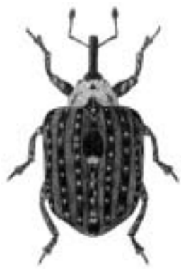
Brunrodsnudebille - Cionus scrophulariae

brysselsk glansløber — Bembidion bruxellense