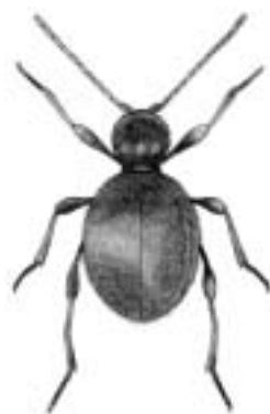
Messingtyv - Niptus hololeucus

hololeucus, Niptus — messingtyv holosericea, Maladera — skræntoldenborre hortensis, Carabus — guldpletløber horticola, Phyllopertha — gåsebille humator, Nicrophorus — sort ådselgraver humerale, Bembidion — skulderplettet glansløber humeralis, Anaspis se fasciata, A. humeralis, Cymindis — glat hedeløber hyalinus, Laccophilus — plettet springvandkalv hybrida, Cicindela — brun sandspringer Hydnobius — jordsvampebiller Hydraena — strømvandkærer Hydrochidae — vandkærer Hydrophilidae — vandkærer Hydroporus — små vandkalve Hydrothassa — sumpbladbiller