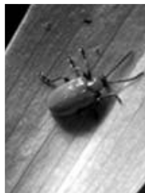
Liljebille (Lilioceris lili) tilhører familien bladbiller (Chrysomelidae).