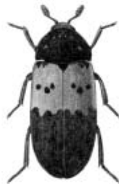
Flæskeklanner - Dermestes lardarius

flæskeklanner — Dermestes lardarius flæskeklannere 2 fløjlsløbere — Chlaenius