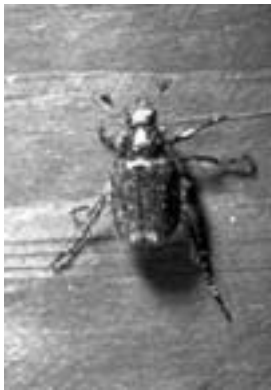
Gåsebille ( Phyllopertha horticola ) tilhører familien torbister ( Scarabaeidae ).

Agyrtidae Leiodidae Hydraenidae Ptiliidae ..... dværgbiller Scydmaenidae Scaphidiidae ..... dråberovbiller Silphidae ..... ådselbiller Staphylinidae ..... rovbiller