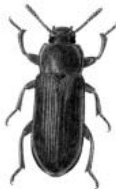
Melskrubbe - Tenebrio molitor

melskrubbe — Tenebrio molitor melskrubber se melbiller messingbille se messingtyv messingfarvet tyv se messingtyv messingtyv — Niptus hololeucus metalbukke 3 metalfarvet dunblødbille se stor malakitbille metalfarvet dunblødvinge se stor malakitbille metalglinseende muldløber se lille metaljordløber metalgrøn bredløber — Anisodactylus poeciloides metalgrøn jordsmælder se egesmælder metalgrøn kalkløber • — Ophonus nitidulus metaljordløber se bred metaljordløber metallisk sandløber — Harpalus affinis metalløber se metallisk sandløber metalløbere se ovalløbere metalskyggebille • — Scaphidema metallicum middagsbuk se smalbuk middagshækkebuk se smalbuk midebille • — Microsporus acaroides midebiller se palperovbiller mindre fluebuk se lille fluebuk mindre metalbuk se langhornet fyrrebuk