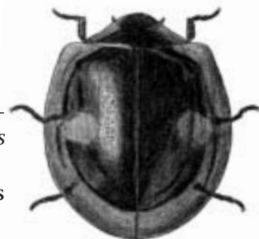
Askemariehøne - Chilocorus renipustulatus

askemariehøne • — Chilocorus renipustulatus askens barkbille se plettet askebarkbille askesnudebille — Stereonychus fraxini