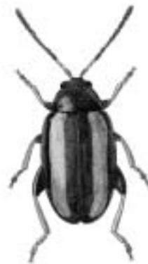
Stor gulstribet jordloppe - Phyllotreta nemorum

stor gulstribet jordloppe — Phyllotreta nemorum stor hjelmbille 1 stor hurtigløber se stor grotteløber stor hvepsebuk • — Plagionotus arcuatus stor hørjordloppe se grønlig hørjordloppe stor jordbille se stor uldtorbist stor jordmøgbille • — Aphodius varians stor kamløber • — Dolichus halensis