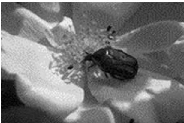
Grøn guldbasse (Cetonia aurata) sammen med glimmerbøsse (Meligethes aeneus) på rosenblomst i have.