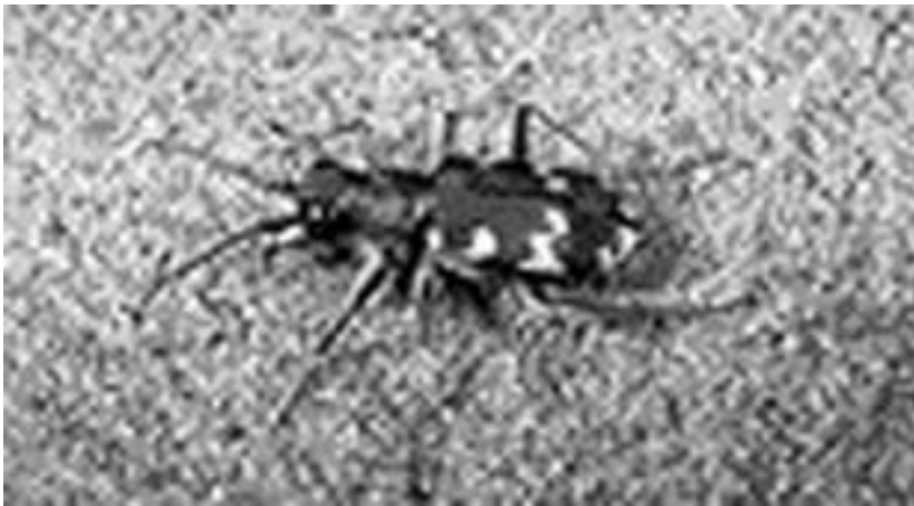
Brun sandspringer (Cicindela hybrida) en repræsentant for løbebillerens familie

Gruppen Cicindelidae opfattes ikke længere som en egen familie, men derimod som en underfamilie Cicindelinae indenfor løbebillerne (Carabidae). I Danmark findes kun 4 arter fra denne gruppe alle tilhørende slægten Cicindela . Navnet sandspringere fra ovennævnte refererence er derfor i databasen hæftet på slægtsnavnet Cicindela , selv om referencens danske navn er knyttet til familienavnet Cicindelidae .