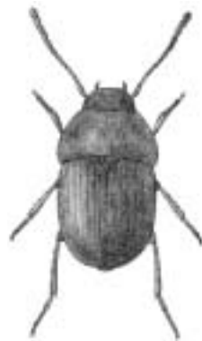
Musebille - Leptinus testaceus

testaceus, Pentaphyllus — dværgskyggebille testaceus, Phymatodes — bøgebuk tetracolum, Bembidion — stor glansløber tetragrammum, Bembidion — firpletet glansløber Tetropium — nåletræbukke Tetrops — havebukke teutonus, Stenolophus — spraglet damløber textor, Lamia — væver thoracica, Oiceoptoma — rødbrystet ådselbille thoracicus, Dyschirius — strandtunnelløber thoreyi, Agonum — langstrakt kvikløber Throscidae — muldsmældere tibiale, Melanimon — lille klitskyggebille tibialis, Amara — dværgagtig ovalløber tomentosus, Byturus — hindbærbille Tomicus — marvbørere Trachys — minérpragtbiller transversalis, Hydaticus — tværstribet vandkalv Trechus — grotteløbere tremula, Chrysomela — aspebladbille Triarthron — jordsvampebiller Tribolium — rismebiller Trichocellus — vinterløbere tridentata, Labidostomis — stor langben trifolii, Apion — rødkløversnudebille tristis, Chlaenius — sort fløjlsløber tristis, Silpha — kornet ådselbille trisulcum, Aulonium — elmecylinderbille