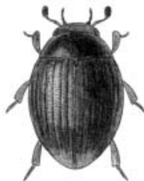
Lille hårlandkær - Cryptopleurum minutum

liden skræntløber se dværgstumpløber liden slankløber se liden kvikløber liden smalbuk se blodrød blomsterbuk liden stumpbille — Hister bissexstriatus liden sædsmælder 1 liden ådselgraver se sortkøllet ådselgraver ligebred græssmælder — Cidnopus aeruginosus ligrøver • — Necrodes littoralis liguster snudebille se lucerneøresnudebille liljebille 2 — Lilioceris lili liljebadbille se liljebille liljekonvalens bladbille se liljebille liljens bladbille se konvalbille og liljebille. lille bladrandbille — Sitona sulcifrons lille blomsterbuk 3 • — Grammoptera ruficornis lille bækklobille se strømklobille lille bønnebille • — Bruchus loti lille cylinderbille • — Teredus cylindricus lille dovenløber • — Clivina collaris lille egefladbille • — Silvanus unidentatus lille elmebarkbille — Scolytus laevis lille firpletet glansløber • — Bembidion quadrimaculatum lille flad jordløber • — Pterostichus longicollis lille fluebuk • — Molorchus umbellatarum lille fyrresnudebille — Pissodes castaneus lille grøn glansløber • — Bembidion deletum lille guldløbebille se lille guldløber lille guldløber — Carabus nitens lille gåsebille se gåsebille lille hvepsebuk • — Clytus arietis lille hørjordloppe se sort hørjordloppe lille hårlandkær • — Cryptopleurum minutum lille jordmøgbille • — Aphodius plagiatus